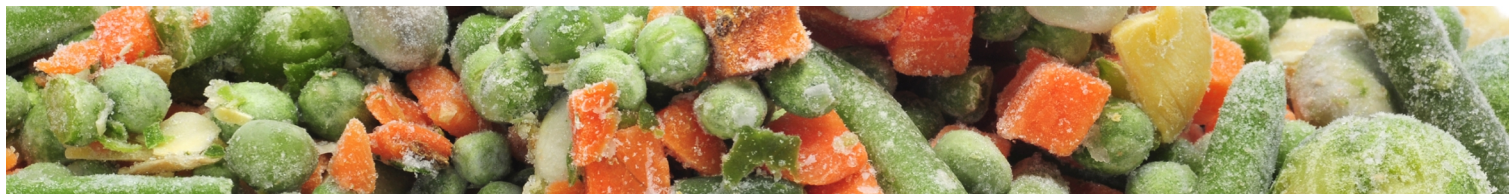
Table Top Fryser