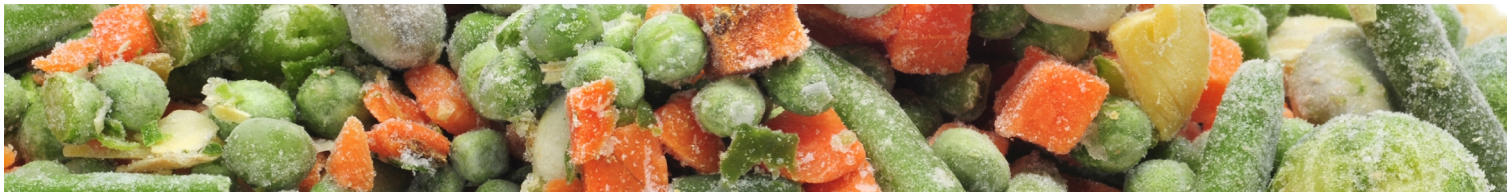
Table Top Fryser