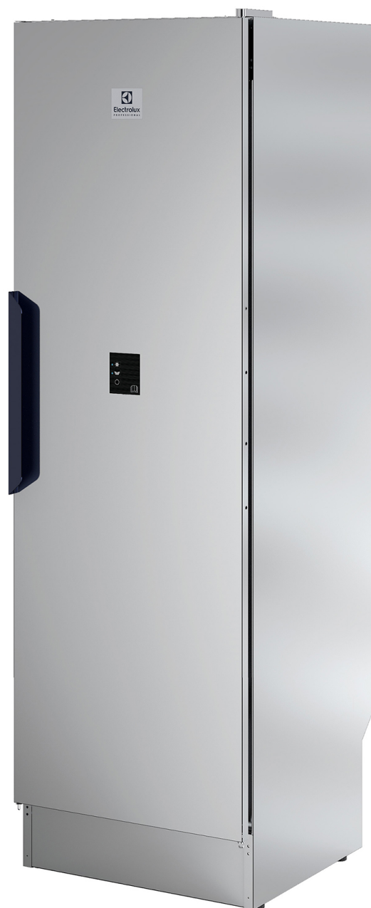
De viste billeder er udelukkende eksempler på produktet, og der kan forekomme variationer.